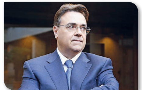
Antonio Llardén, presidente de Enagás

Durante su comparecencia en la Comisión de Transición Ecológica del Senado, el presidente de Enagás, Antonio Llardén, ha asegurado que la descarbonización de la economía no es solo un proceso de electrificación, defendiendo que el gas natural jugará un papel "fundamental" en el proceso de transición energética, y que el proceso solamente podrá llevarse a cabo "si se tiene al gas natural como energía de puente", destacando la relevancia de los gases renovables, como biogás e hidrógeno.